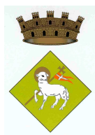
Ajuntament del Catllar