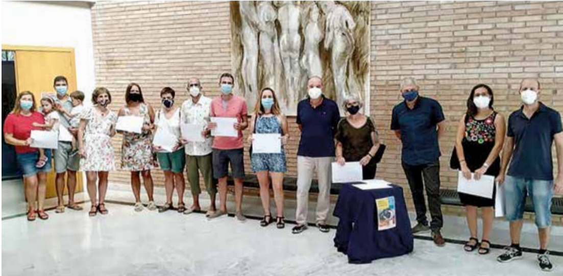
Una imatge dels guanyadors de l'edició 2022 del concurs.

El Concurs de Fotografia per al Calendari 2023 del Catllar està en marxa. Les bases estan en fase d'exposició pública a falta de la seva aprovació definitiva, en breu. Es premiaran 12 imatges d'àmbit municipal i de temàtica lliure (artístic, festiu, natura, cultura, patrimoni, civisme...), que s'empraran en el calendari municipal de l'any 2023. El concurs està obert a qualsevol persona, professional o aficionada, major de 18 anys.