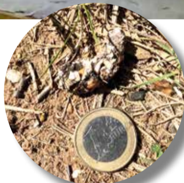
Excrement de visó americà fotografiat a Vila-rodona.