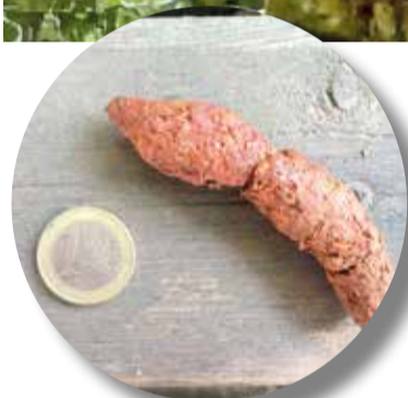
Excrement de visó americà a l'embassament.