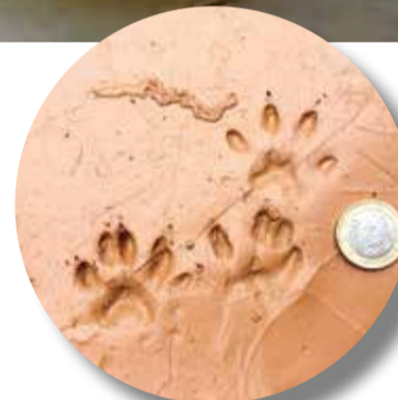
Petjades de visó americà. Montferri.

o alliberats intencionadament. És una espècie exòtica invasora que afecta negativament la biodiversitat autòctona característica d'aquells hàbitats (zones humides i ecosistemes fluvials, així com zones costaneres i illes) en els quals s'estableix, com és el cas del riu Gaià.