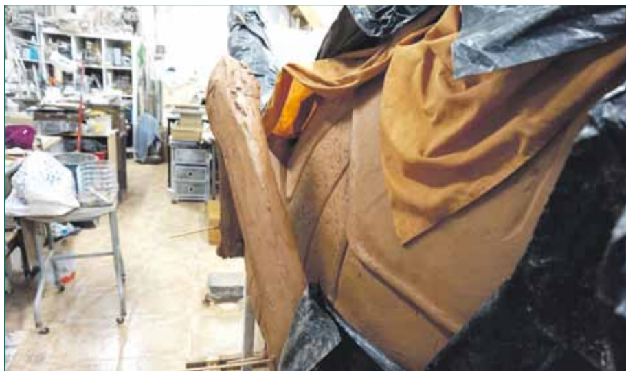
Una imatge d'una de les potes de la llagosta. De fang se'n trauran els motllos.

Ja feia un parell d'anys que la idea de tenir una bèstia de foc corria pel cap dels Diablers, però no va ser fins a principi d'aquest any que, amb el suport de l'Ajuntament del Catllar, se'n va iniciar